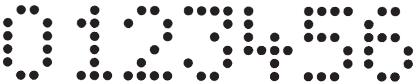
20 mm, 4 x 6 Punkte, Ø Nadel 2,3 mm