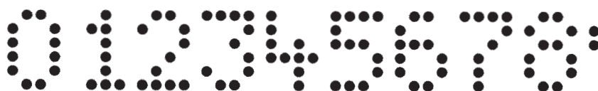
15 mm, 4 x 6 Punkte, Ø Nadel 1,8 mm